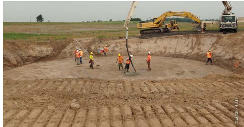
Fondations d'une éolienne de 2 MW

Les augmentations des factures prévues ne seront cependant pas suffisantes pour payer les gigantesques infrastructures de réseaux qu'EDF est obligé de construire pour honorer les permis de construire accordés... Alors qui va payer ?