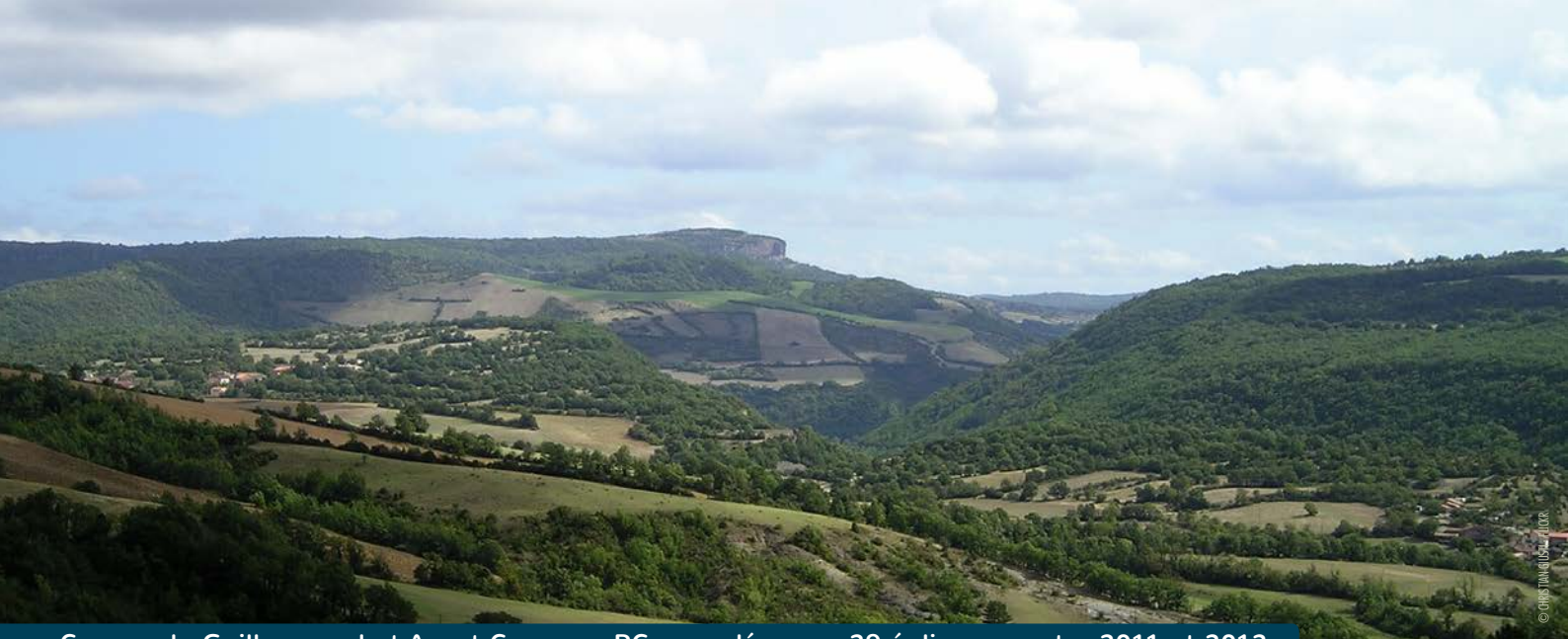
Causse du Guilhaumard et Avant-Causse, PC accordés pour 29 éoliennes entre 2011 et 2012