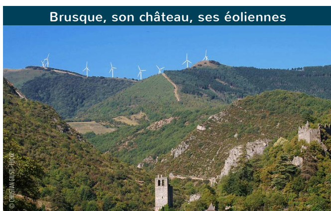
Brusque, son château, ses éoliennes