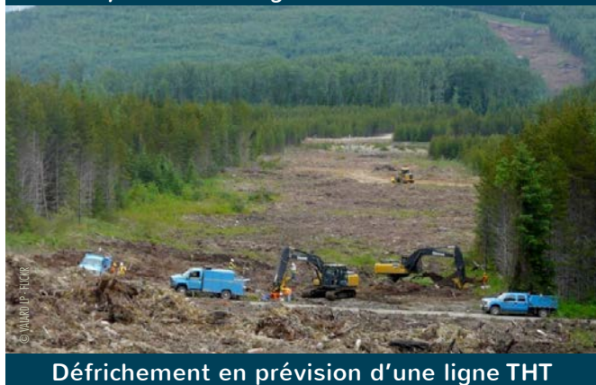
Défrichage en prévision d'une ligne THT

À Saint Victor et Melvieu, au coeur de magnifiques terrains agricoles classés AOP, malgré l'opposition des jeunes fermiers et de la population, un méga-transformateur, clef de voûte du dispositif, devrait bientôt voir le jour sur 7 hectares. Capable de transporter l'énergie de 800 éoliennes, ce transformateur surdimensionné préfigure-t-il le nombre de machines restant à implanter en Aveyron, contrairement aux affirmations des élus, ou est-il un simple gaspillage financier ?