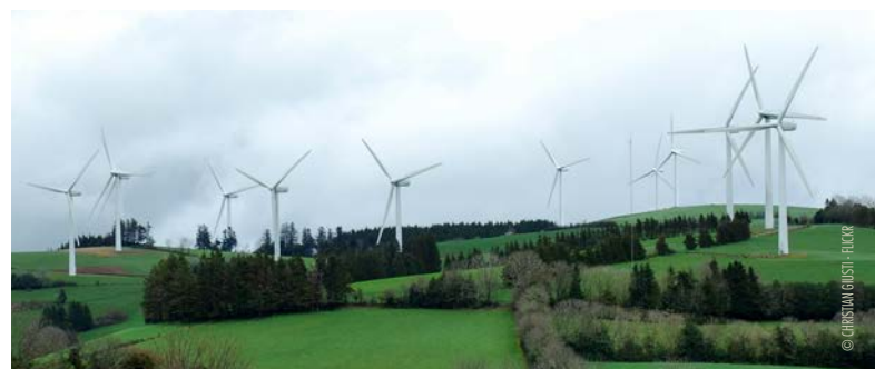
Le charmant bocage industriel de Murat sur Vèbre