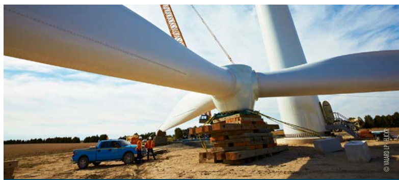
Eolienne Puissance 2 MW

À Saint Victor et Melvieu, au coeur de magnifiques terrains agricoles classés AOP, malgré l'opposition des jeunes fermiers et de la population, un méga-transformateur, clef de voûte du dispositif, devrait bientôt voir le jour sur 7 hectares. Capable de transporter l'énergie de 800 éoliennes, ce transformateur surdimensionné préfigure-t-il le nombre de machines restant à implanter en Aveyron, contrairement aux affirmations des élus, ou est-il un simple gaspillage financier ?