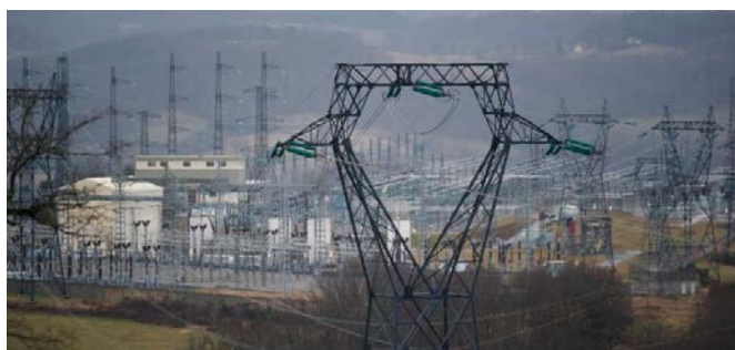
A Rueyres, un avant-goût du tranfo de St Victor

Dans cet élan, les centrales éoliennes ont été implantées sans même s'assurer des réseaux de transport nécessaires pour évacuer l'électricité. Des infrastructures lourdes, transformateurs et lignes très haute tension (THT), devront être construites à grand frais à travers le pays.